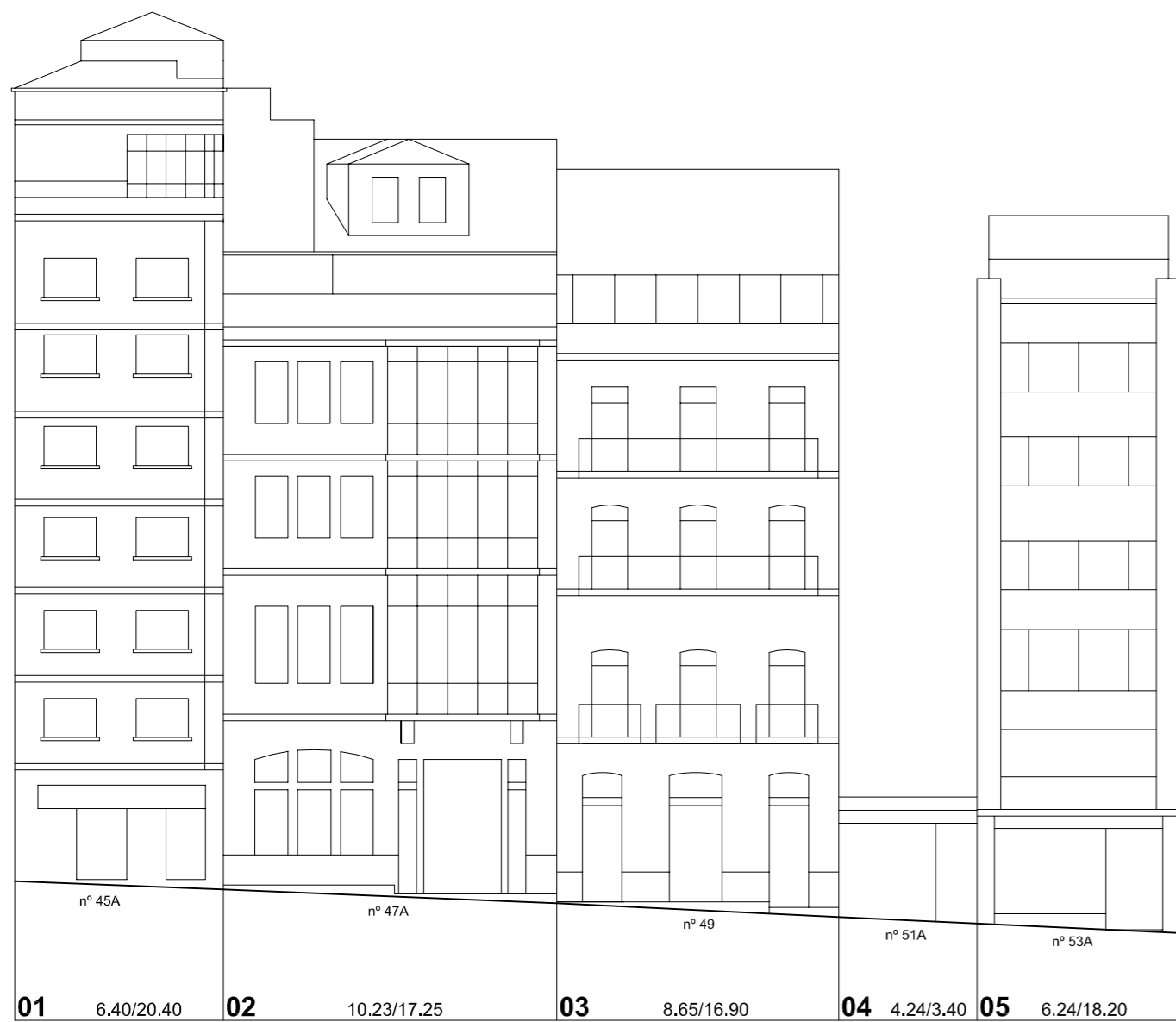
Rúa Teófilo Llorente